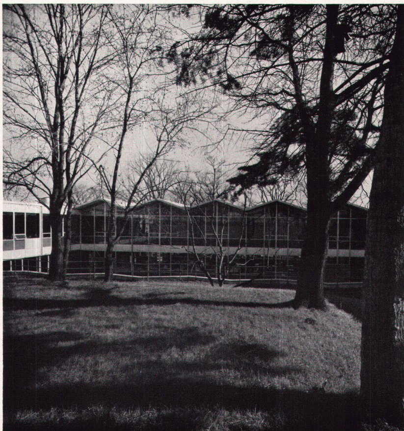
1 Ansicht von Nordosten mit Klassentrakt und Bibliothek Vue prise du nord-est, avec bâtiment des classes et bibliothèque View from the northeast with classroom wing and library