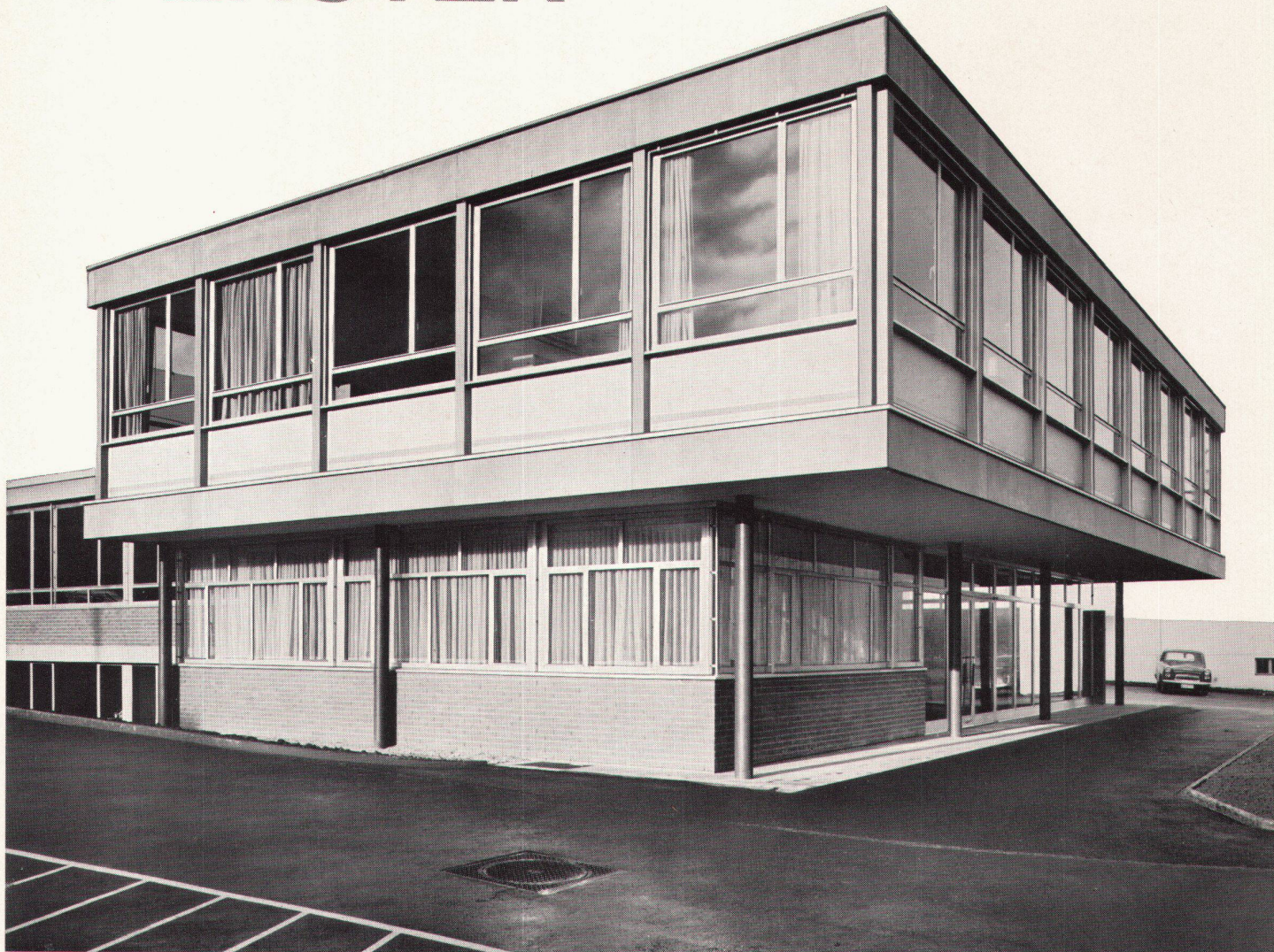
Modernes GLISSA-Bauprofil-Programm Konstruktionen für höchste Ansprüche

Bürogebäude der Radiatorenfabrik Gebr. Zehnder AG, Gränichen H. Hauri, dipl. Arch. ETH, Reinach AG