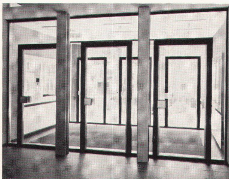
Schaufenster-Anlagen Türen — Portale

Bürogebäude der Radiatorenfabrik Gebr. Zehnder AG, Gränichen H. Hauri, dipl. Arch. ETH, Reinach AG