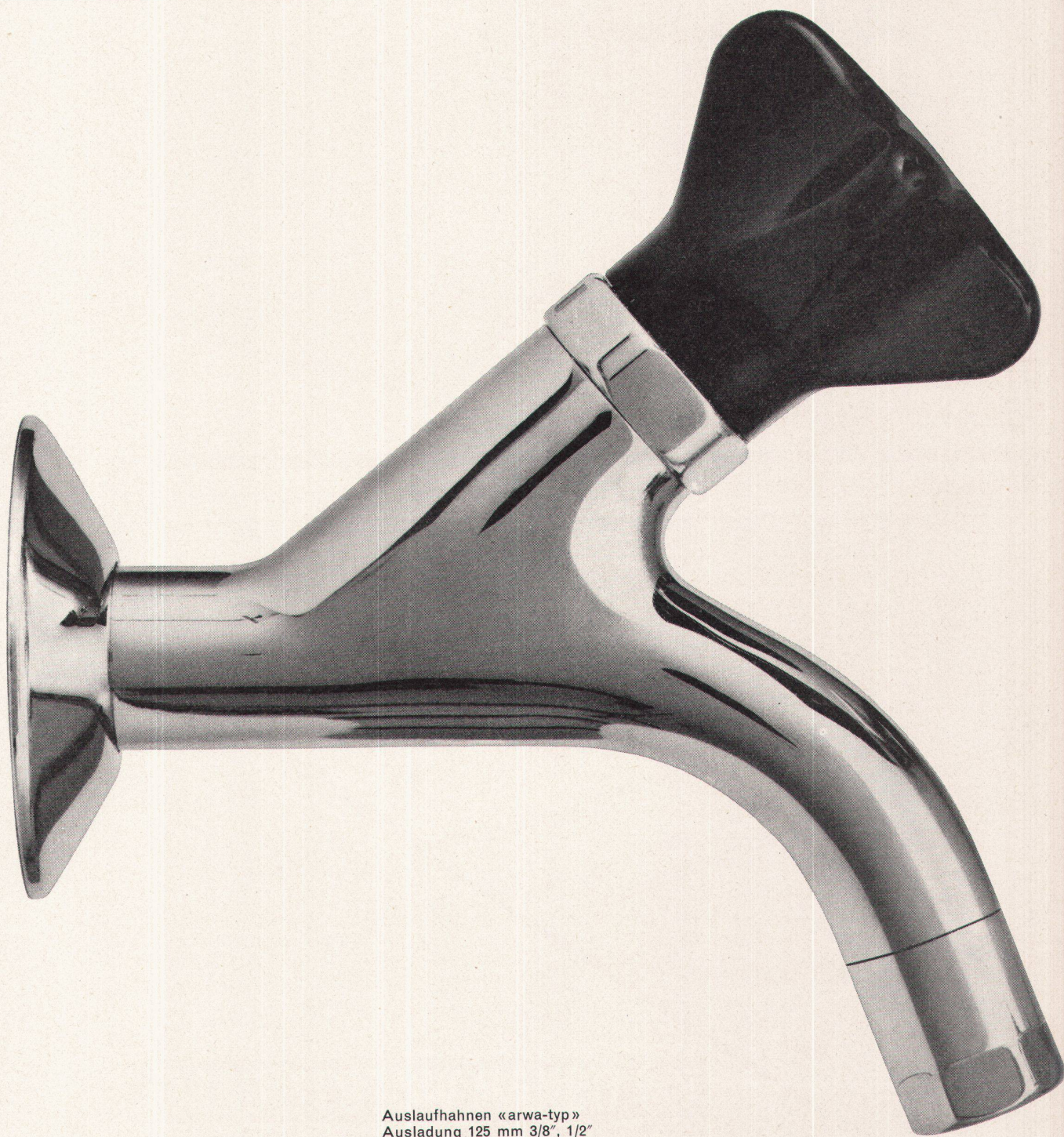
Auslaufhahnen «arwa-typ» Ausladung 125 mm 3/8", 1/2"

Armaturenfabrik Wallisellen AG Neue Winterthurerstraße 120 Telephon 051 93 31 77