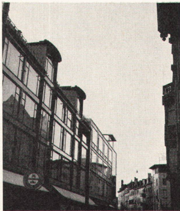
6 Alt und Neu – das eigene Gesicht und das der Nachbarn in der Glasfassade