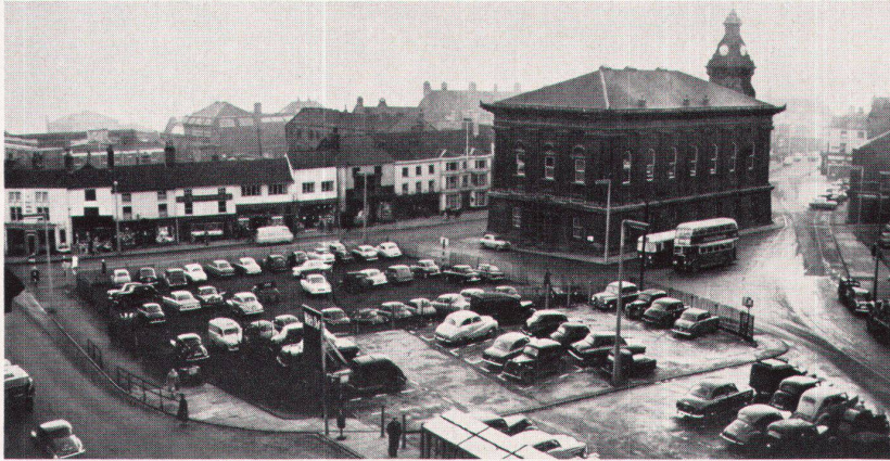
1 Das Stadtzentrum vor der Sanierung Le centre de la ville avant l'assainissement Town center before reorganisation

Im Jahre 1959 wurde die Magdalen Street in Norwich in diesem Sinne saniert, im vergangenen Jahre das Zentrum von Burslem, das wir hier im Bilde zeigen. Der Erfolg dieser Aktion dürfte auch die zuständigen Instanzen unseres Landes zu ähnlichem Vorgehen ermutigen; für den Schweizerischen Werkbund zum Beispiel könnte dies eine dankbare Aufgabe bedeuten. Die Redaktion