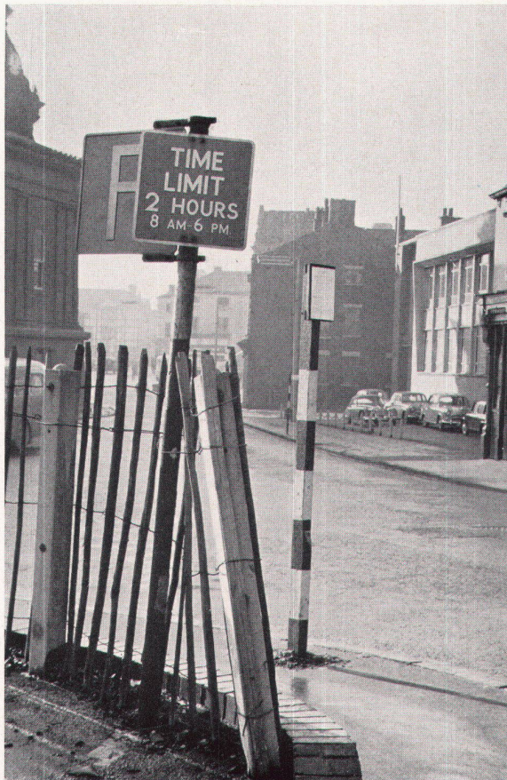
2 Detail einer Straßenecke vor der Sanierung Détail d'une rue avant l'assainissement Street-corner detail before reorganisation