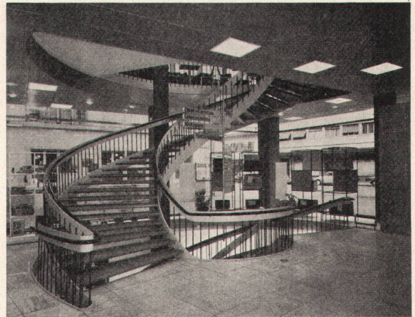
Ladengeschäft in Basel

Linoleum, Plastroflor, Sucofloor, Kunststoff-Platten, Spannteppiche