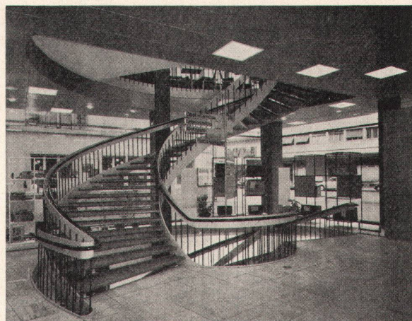
Ladengeschäft in Basel

Linoleum, Plastroflor, Sucofloor, Kunststoff-Platten, Spannteppiche