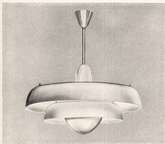
2712 «Stufen- leuchte»