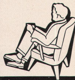
Klimaanlage «System Häusler» in Kinotheater

Walter Häusler & Co. Spezialfirma für Luftkonditionierung und Lüftung