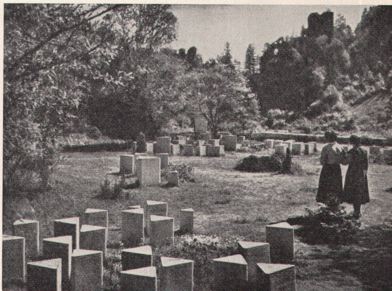
1, 2 Friedhof in Draga bei Begunjah, Jugoslawien. Architekt: Prof. Edo Ravnikar.