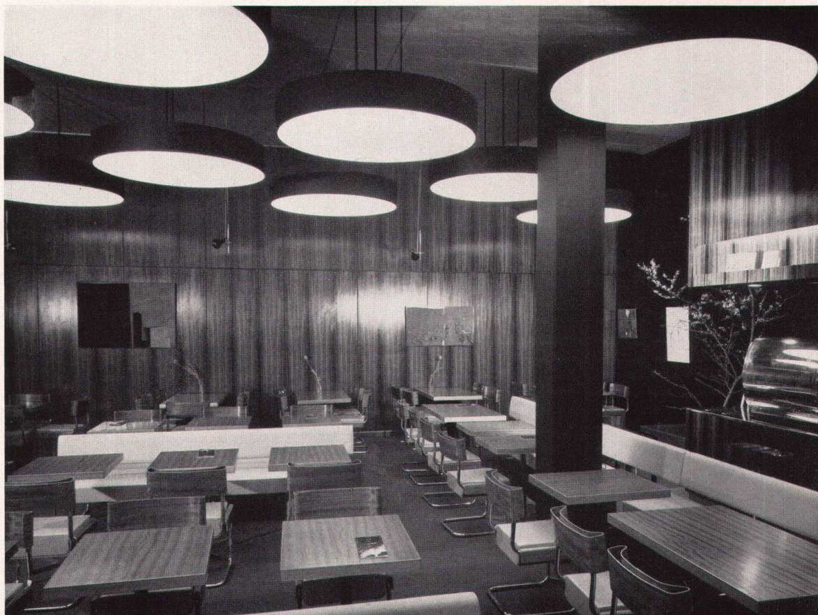
1 1959. Architekten: Hafner und Räber, Zürich

In einem Bürohaus-Neubau im Zentrum der Stadt Bern galt es, ein Café-Restaurant zu erstellen. Dem 110 m 2 großen rechteckigen Gastraum mit 85 Plätzen konnten auf gleicher Höhe Küche, Personalraum und Toiletten angegliedert werden. Die Art des Betriebes gestattete eine kleine Küche für eine begrenzte Speisekarte. Im Gastraum wurden die beiden Seitenwände und der Ausbau über dem Buffet, hinter dem die technischen Apparate eingebaut sind, in Palisanderholz ausgeführt. Um eine große Raumtiefe zu erzielen, wurde die Rückwand mit schwarzen Holzplatten belegt. Die baulich gegebene große Raumhöhe von 4,50 m wurde mittels frei hängenden zylindrischen Beleuchtungskörpern reduziert. Die Glasfront längs der Straße ist mit Schiebefenster ausgestattet. Tische und Stühle sind in Macoréholz.