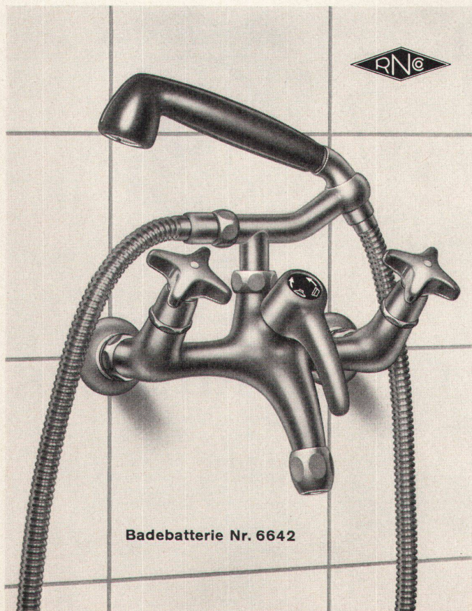
Badebatterie Nr. 6642

Brunner & Cie., Lenzburg E. Dillier, Sarnen Ganz & Co. Embrach AG, Embrach Ofenfabrik Kohler AG, Mett-Biel Gebrüder Kuntner, Aarau Gebrüder Mantel, Elgg