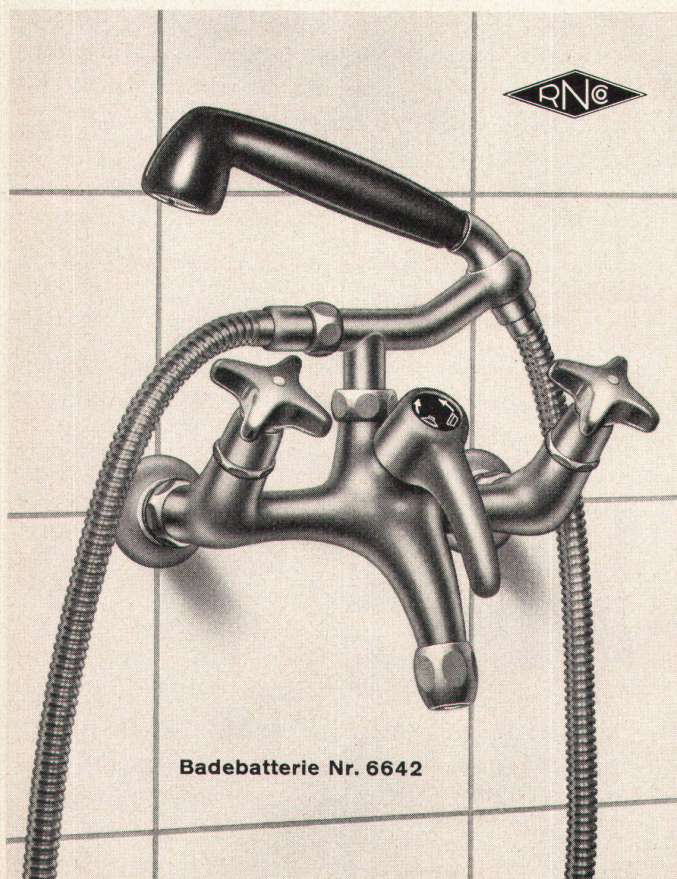
Badebatterie Nr. 6642