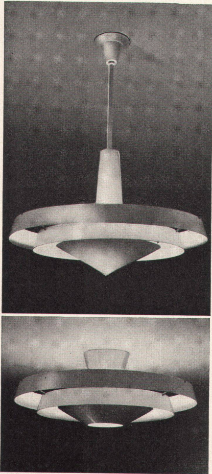
LICHT+FORM - Leuchten sind zweckmäßig, formschön und preiswert