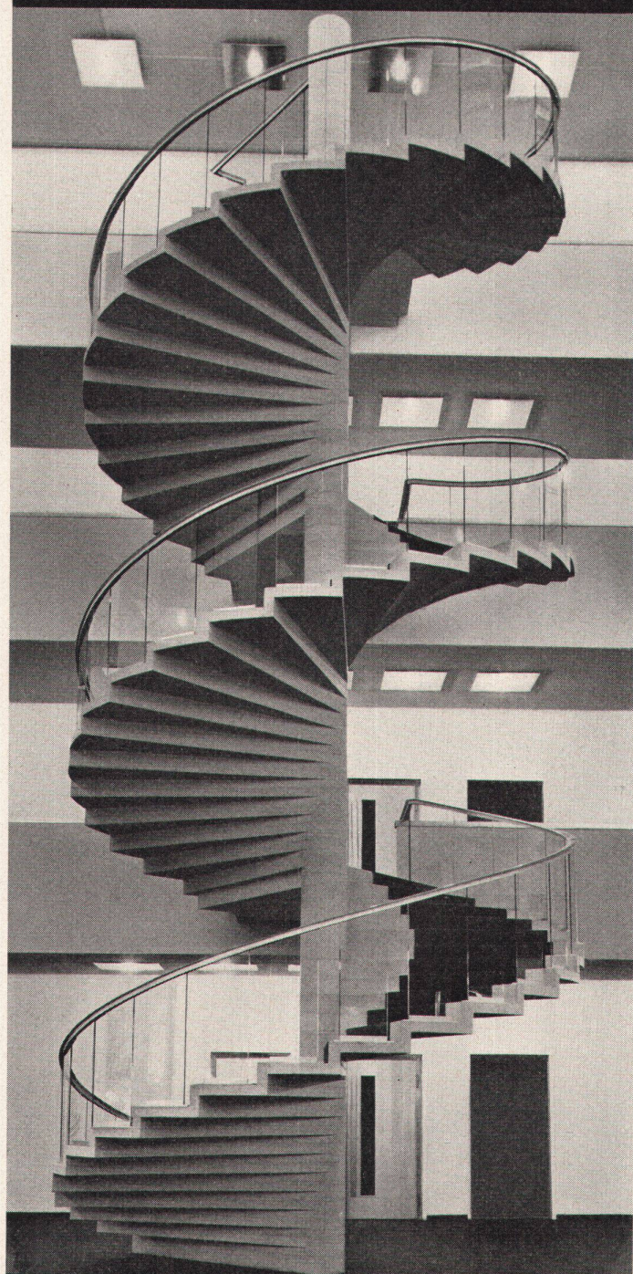
Freistehende Spindeltreppe, Verwaltungsgebäude AIAG, Zürich

Treppenanlagen, Betonfenster Fassadenverkleidungen Bodenbeläge Vorfabrizierte Sichtbetonelemente Ausführung sämtlicher Kunststeinarbeiten