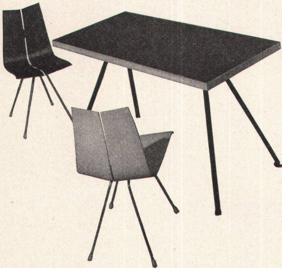
Stuhl Modell 4017 St Tisch Modell 7060 St

Hagenholzstraße 60 Telefon 051 | 46 43 44