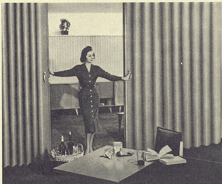
Harmonika-Türe Mischler als Trennung zwischen Wohnraum und Essplatz in einem Einfamilienhaus

Harmonika-Wände System Mischler mit Metallgerippe in abwaschbarem Kunstleder Montage ohne Bodenschienen Formschöne Trennwand in Wohnhäusern, Restaurants, Sälen, Turnhallen und Kirchgemeindehäusern