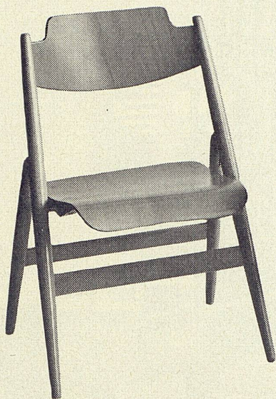
Entwurf: Prof. Eg. Eiermann