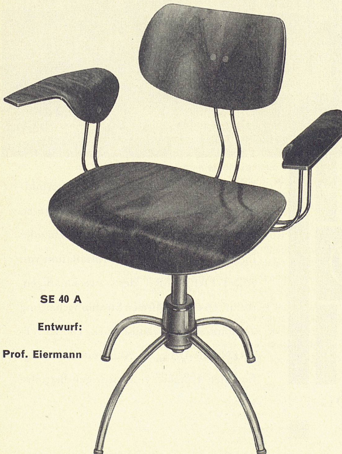
SE 40 A