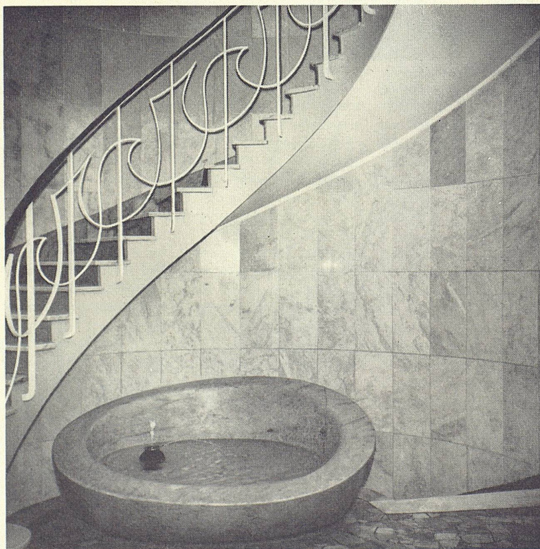
Kant. Brandversicherung, Luzern (gesamter Innenausbau)

Marmor ist und bleibt edelster Baustoff. Dank seiner hohen Qualität und Wertbeständigkeit, wird er zum preisgünstigsten Baustein für Außenfassaden und Innenausbau.