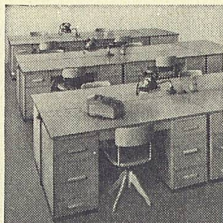
Schreibtische Büromöbel Küchenmöbel