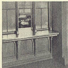
Schaltertische Fenstersimse Verkaufstische usw.

Das einzigartige Material, das beim Bau von Möbeln aller Art, im Innenausbau moderner Räume usw. völlig neue, überraschende Lösungen ermöglicht. 9 verschiedene Farben, warm, isolierend wie Holz, hart, äußerst strapazierfähig, farbbeständig, rißfest, verarbeitbar wie Holz