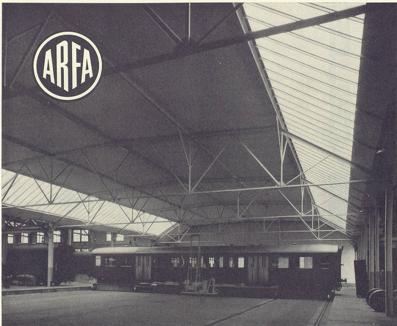
SBB Reparaturwerkstätte Olten, Binderkonstruktion ausgeführt mit ARFA Konstruktionsrohren durch Geillinger & Co., Winterthur