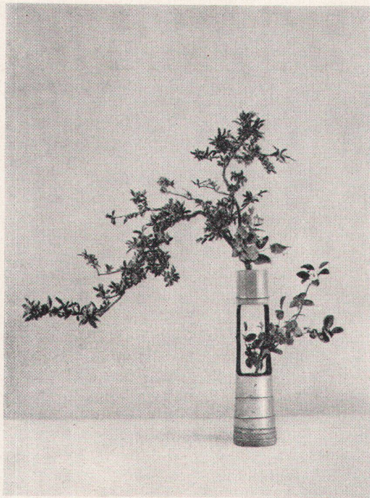
Japanisches Blumenarrangement. «Mit dieser Doppelform eines klassischen Arrangements will man die Atmosphäre des Hochsommers zum Ausdruck bringen. Mit den hochroten Blüten des Granatum wird die Hitze ausgedrückt, während die Takeda H. var. parviflora eine gewisse Kühle vermittelt. Auch die weiße Pseudokamelie im untern Teil sorgt für ein Gefühl der Kühle und hilft zugleich, die Wirkung der roten Blüten im obern Teil zu dämpfen.» Bild und Legende aus: Hiroshi Ohchi, Ikebana

Nicht minder brauchbar ist der geschichtliche Teil des Buches, wo über das Werden der besonderen Formen des Ikebana berichtet wird. Abweichend von anderen, aber nicht unberechtigt, nennt sie Ohchi: Rikka, Shoka, Nageire und Moribana. Indes hat vielleicht mancher eine dankbare Erwähnung des indisch-chinesischen Ursprungs der Blumenkunst erwartet. Nur bei einer Bildunterschrift wird des Einflusses chinesischer Kultur, nämlich auf das Arrangement von Pfingstrosen, gedacht. So wird der Eindruck erweckt, die Blumenkunst sei eine betont japanische Leistung; sie liegt eher in der Bewahrung und Entwicklung dieser von China übernommenen Kunst. Und das ist für wahr viel!