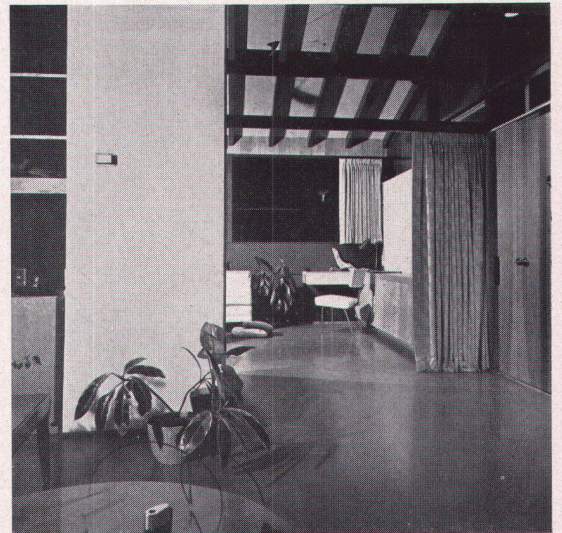
5 Blick in den Wohnraum des Hauses Moore Partie de la grande salle de la maison Moore Part of the Moore house livingroom