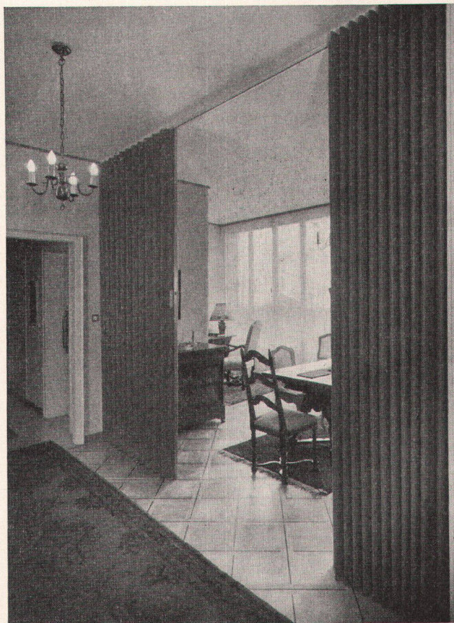
modernfold -Harmonikatüren passen in jeden Raum, ob im Hotel, Restaurant oder im Privathaus

Schienenlose Bodenführung, stets gleichmäßige Lage der Falten und die Möglichkeit, modernfold auch in gebogener Anordnung führen zu können, kennzeichnen die technischen Vorzüge und Eigenheiten dieser «beweglichen Wände» in besonderem Maße. Ihre bequeme Einbauweise und der äußerst geringe Raumbedarf begünstigen sowohl ihre bauseitige Einplanung als auch nachträgliche Anbringung. Einen Ausschnitt ihrer vielseitigen Verwendungsmöglichkeiten zeigen Ihnen unsere Prospektunterlagen, die wir Ihnen auf Wunsch gerne zustellen.