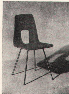
Modell 4015 St

Baubeschlägefabrik und Metallbau U. Schärers Söhne, Münsingen Telephon (031) 68 14 37