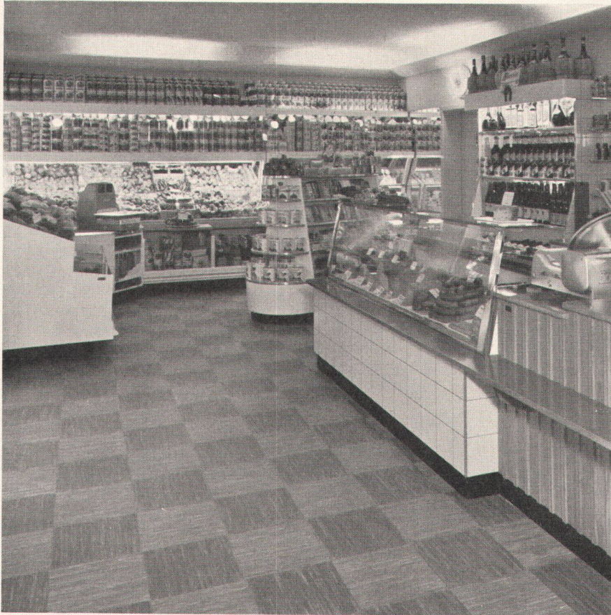
Comestibles G. Gisler, Altdorf

Architekten Lüscher & Clavadetscher, St. Gallen