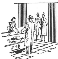
Verkaufsräume Magasins de vente

Les portes coulissantes MODERNFOLD offrent plus que la solution appropriée du problème de la fermeture et des séparations secondaires. Par leur aspect élégant et surtout décoratif, elles confèrent à ce qui les entoure un certain cachet et elles s'adaptent harmonieusement à la décoration intérieure moderne. Leur sobre élégance et leur maniement facile, le fonctionnement impeccable de ces «cloisons mouvantes» leur repli régulier en n'importe quelle position, sont la raison pour laquelle les architectes et les constructeurs donnent de plus en plus la préférence aux portes coulissantes MODERNFOLD. Elles ne nécessitent aucun rail au plancher, elles peuvent se mouvoir en cercle, offrant ainsi les plus grandes possibilités d'aménagement et d'économie d'espace. La plus grande cloison pliante que nous avons exécutée jusqu'à présent a 22 m de large et 6 m de haut, elle est aménagée en double S et commandée par moteur électrique.