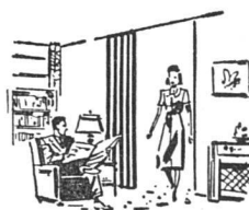
Ihr Heim Votre home