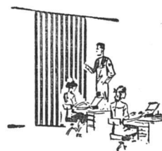
Im Büro Au bureau

Erfahrenes Fachpersonal für Beratung und Offerte, sowie Spezialprospekt und Referenzliste stehen jederzeit zu Ihrer Verfügung.