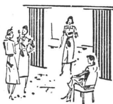
Aufenthaltsräume Salles de séjour