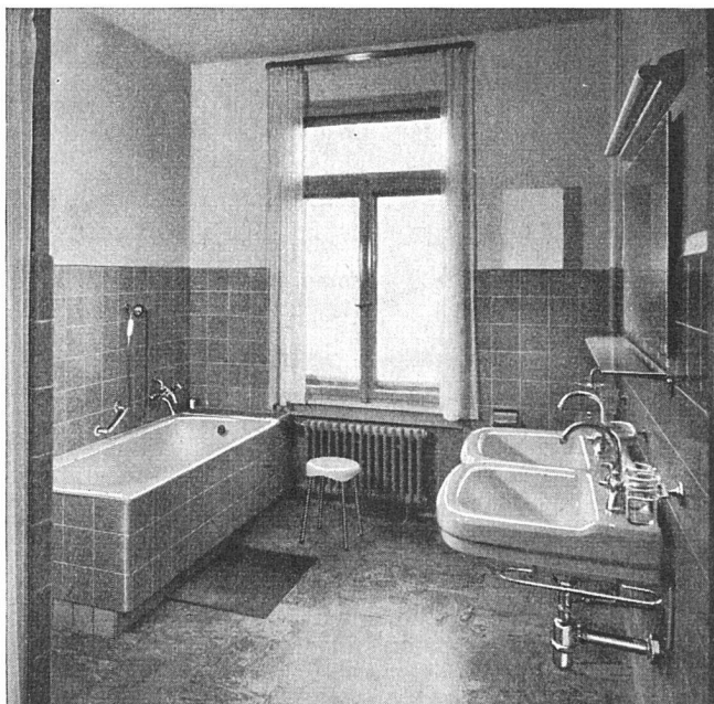
Aus unserer Ausstellung: Badezimmer mit Apparaten in Elfenbein