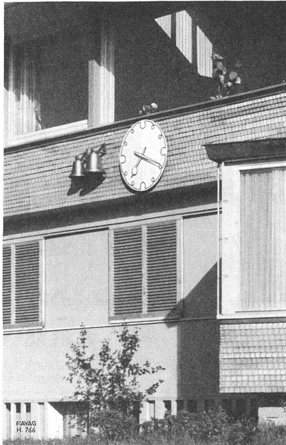
Schulhaus Matt, Hergiswil