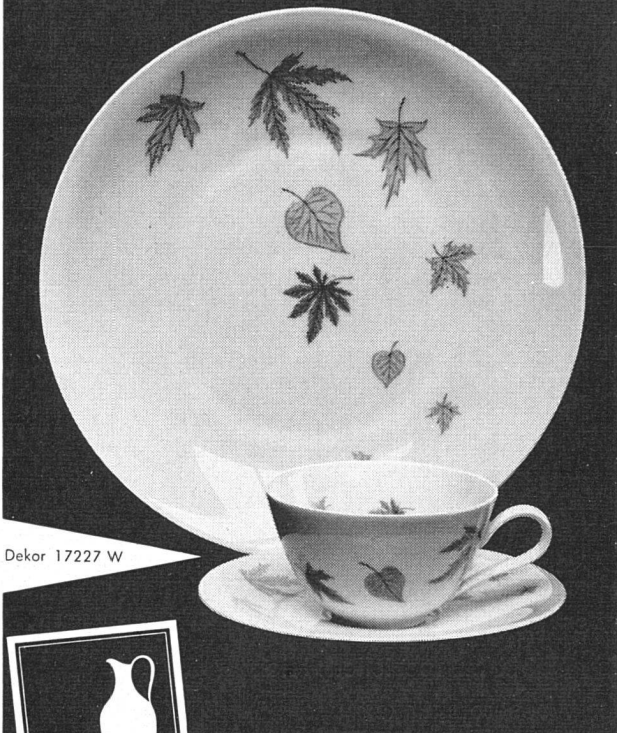
Dekor 17227 W