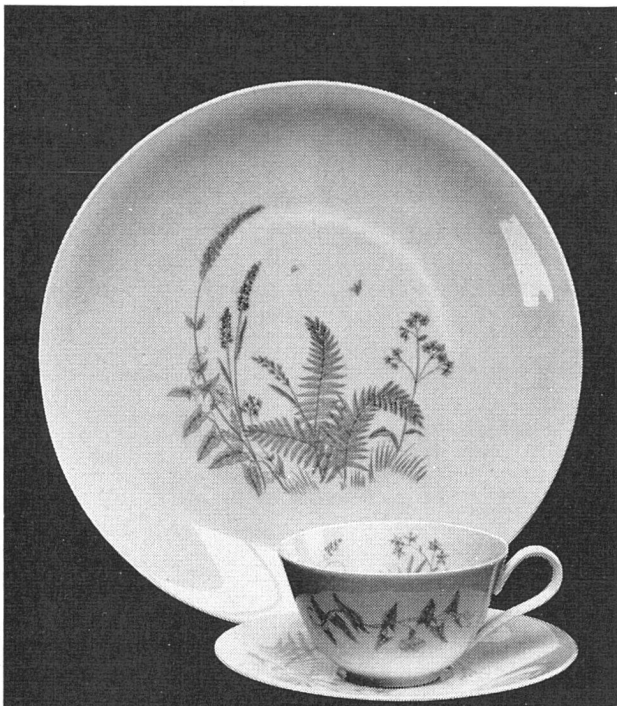
Dekor 17222 W