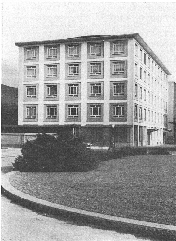
Basel: Sandoz AG, chem. Fabrik

Thermopane ist ein Produkt der SA Glaces & Verres «Glaver» (Belgien)