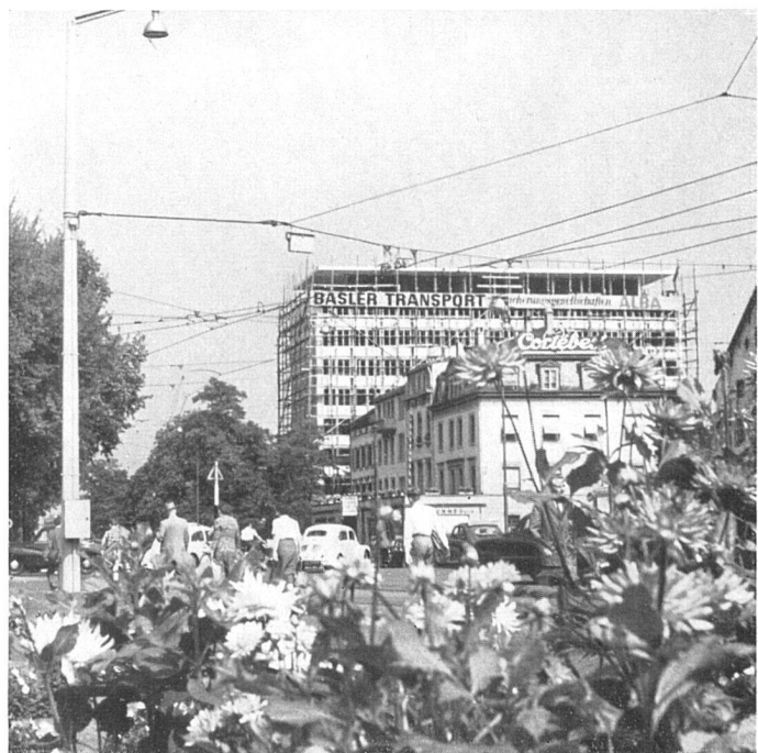
Das Bürohaus von Südwesten (Aufnahme Ende August 1955, Beschriftung provisorisch) / Vue prise du sud-ouest / From the south-west

Konstruktion: Eisenbetonskelettbau; Marmorverkleidung der geschlossenen Stirnwände und Fensterpfeiler; Fenster mit Brüstung als Element aus Metall (Koller AG, Basel). Freiplastiken an Fassade und beim Eingang.