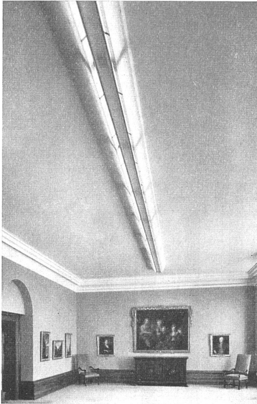
Gemäldegalerie Stiftung Dr. Oskar Reinhart, Winterthur

Die Projektierung der Beleuchtungsanlage eines Museums erfordert neben lichttechnischem Fachwissen große Erfahrung in diesem Spezialgebiet. — Wir sind in der Lage, Sie gut zu beraten.