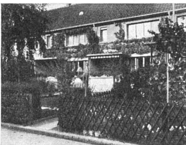
Reihenhäuser «Bircherdörfli» in Zürich, 1935

kolonien für die Allgemeine Baugenos-senschaft Zürich, etliche Privat- und Geschäftshäuser vor allem in Oerlikon, das Volkshaus in Oerlikon, die Innen-