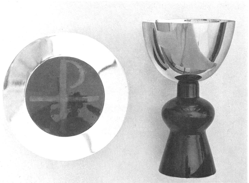
Patena und Kelch, Silber vergoldet / Plat et bocal, en argent doré / Plate and chalice, gilded silver