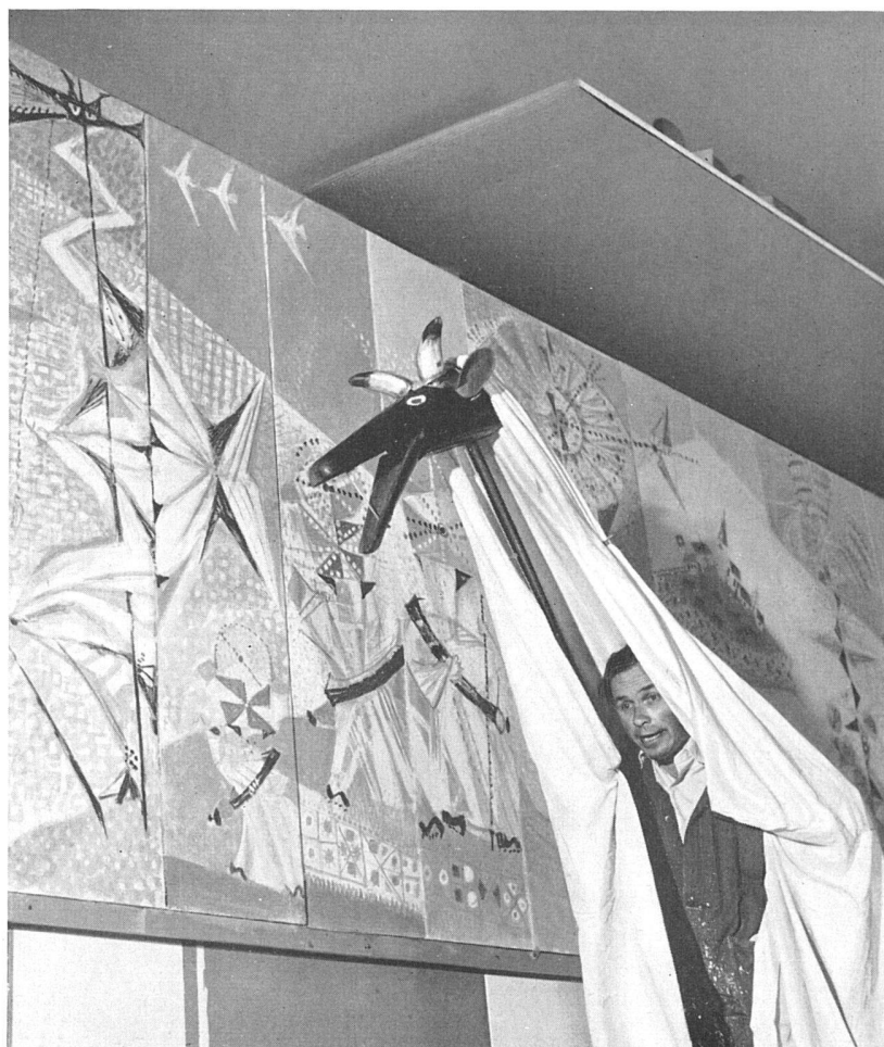
Der Künstler demonstriert die «Schnabelgeiß» / L'artiste faisant une démonstration de la «Chèvre à Bec» / The artist demonstrating «the Schnabelgeiß» (Beaked Goat)