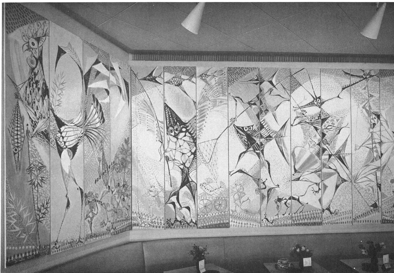
Hans Fischer, Maskenzug. Wandbild im Warteraum des Flughofes Kloten / Cortège de masques. Peinture murale dans la salle d'attente de l'aéroport de Zurich-Kloten / Procession of the Masks. Mural in the departure hall of Zürich airport

Linke Hälfte des Wandbildes / Moitié gauche de la peinture murale / Left half of the mural