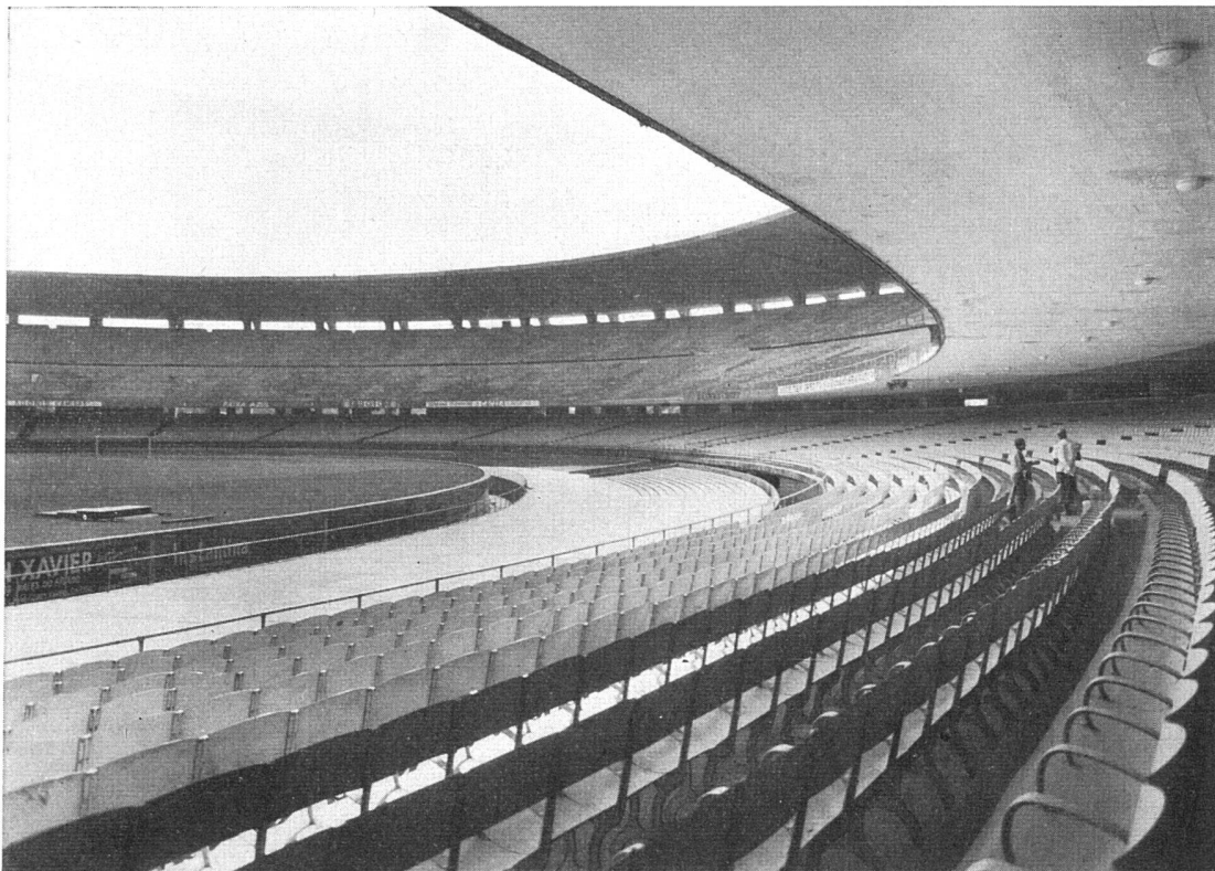
Stadion von Rio de Janeiro, Fassungsvermögen von über 200 000 Personen, erbaut unter Verwendung von PLASTOCRETE