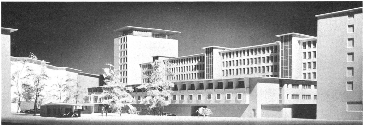
Modellansicht mit Autohotel / Maquette; au premier plan le motel / The model, in the foreground parking area and motel