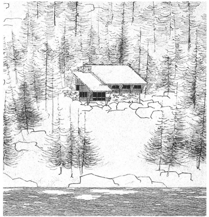
Gesamtansicht von Südwesten / Vue prise du sud-ouest / General view from the south-west