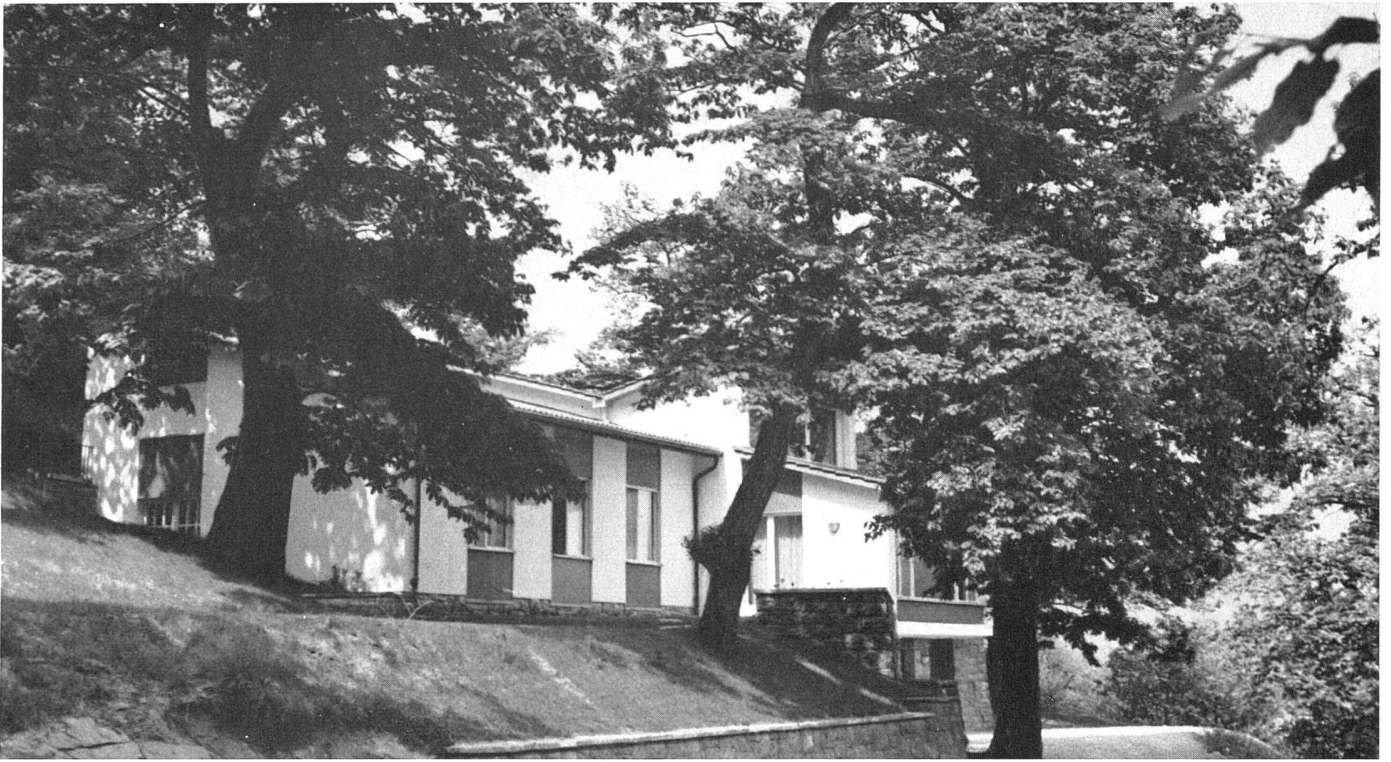
Gesamtansicht von Süden | Vue prise du sud | General view from the south