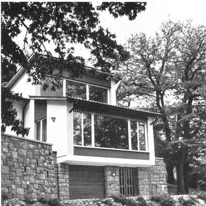
Südwestliche Stirnseite | Façade sud-ouest | South-west elevation