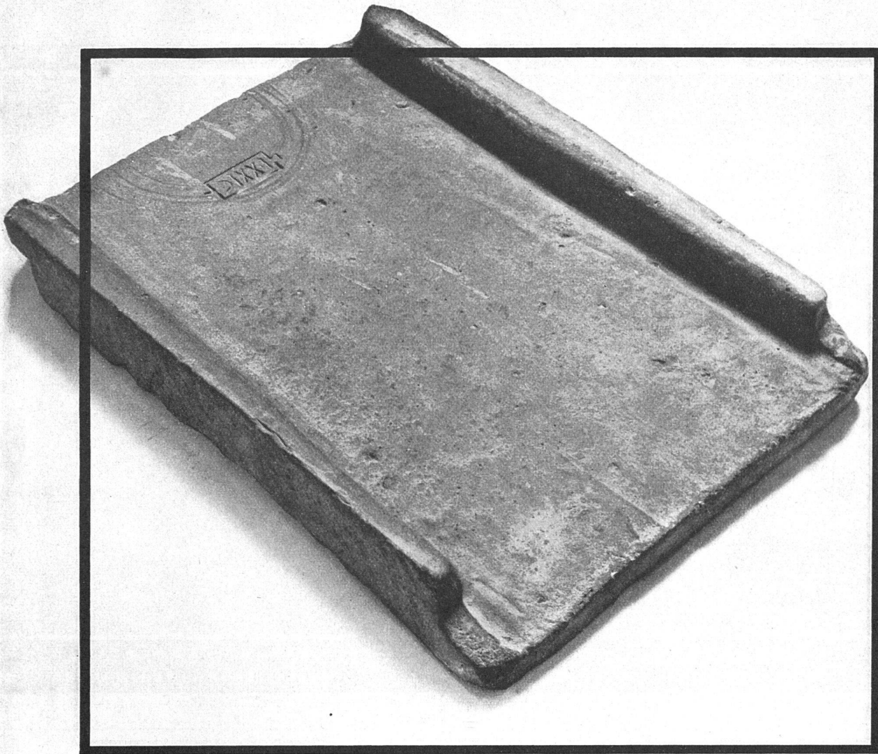
Römischer Legionsziegel 50-450 n. Chr. aus der Umgebung von Zürich Schweiz. Landesmuseum