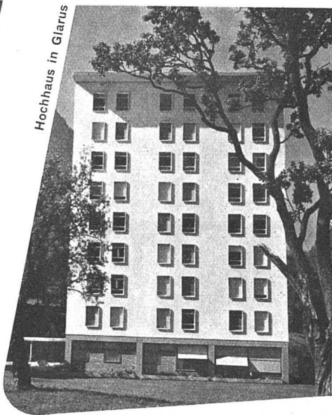
Hochhaus in Glarus