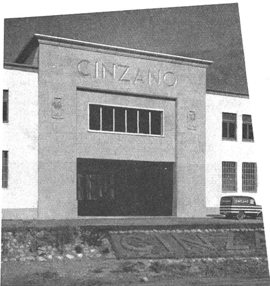
Fabrik in Villafranca (Spanien)