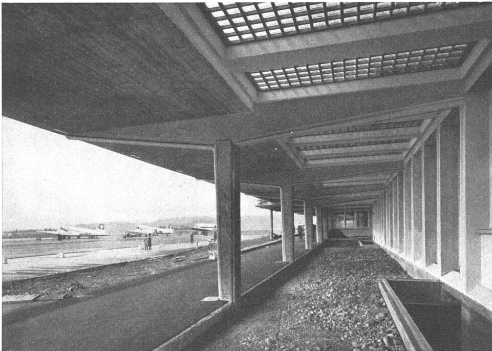
Aufnahmegebäude des Interkontinentalflughafens Zürich-Kloten