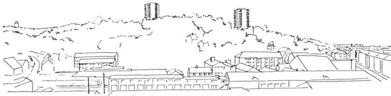
Wohnhochhäuser am Hechtliacker, Basel. Projekt von O. II. und W. Senn, Architekten BSA, Basel. Die Hochhäuser als bereichernde Akzente des Landschaftsbildes

Das Baumassiv des topographisch exponierten Geländes tritt im Landschaftsbild markant in Erscheinung. Gemäß dem Zonenplan ist die Überbauung mit zweigeschossigen Wohnhäusern vorgesehen. Die Bautätigkeit hatte in den zwanziger Jahren sporadisch eingesetzt mit der Erstellung von freistehenden und zusammengebauten Einfamilienhäusern. Der nach Norden fallende Hang, der wasserführende Untergrund, die Nachbar-