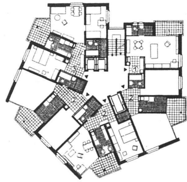
Oben: Normalgeschoß 1:500. Norden oben