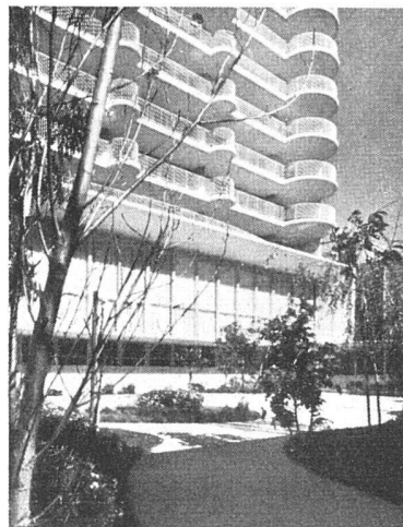
Rekonvaleszentenspital in San Francisco, 1951

gewirkt, dem bekanntlich Raum- und Formdynamik und fließend expressive Linienführung das besondere, neue Wege eröffnende Gepräge verleihen. Eine enge Freundschaft verband Mendelsohn mit dem bewunderten Meister bis zum allzu frühen Tode.