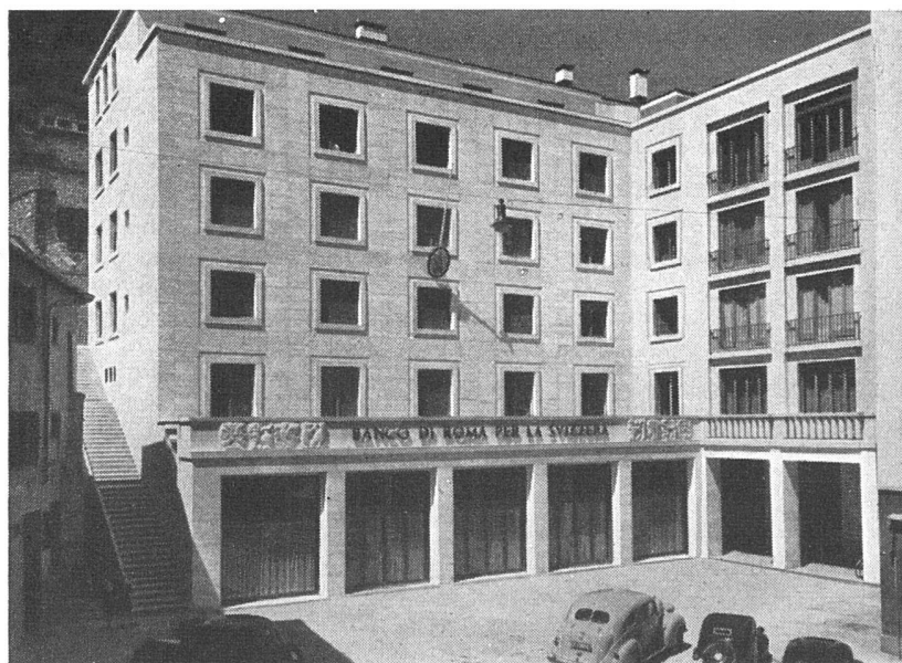
Banco di Roma per la Svizzera, Lugano

Grundwasser-, Ter- rassen- und Flach- dach-Isolierungen ca. 1900 m 2