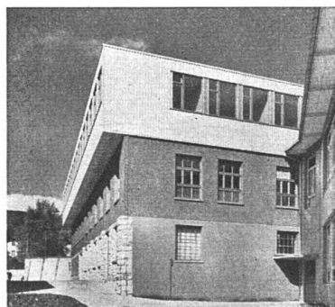
Schenker-Storen AG., Schönenwerd

FURAL als bewährtes Bedachungs- und Wandverkleidungsmaterial findet dank seiner Zweckmäßigkeit, Wirtschaftlichkeit und guten architektonischen Wirkung stets mehr Verwendung.