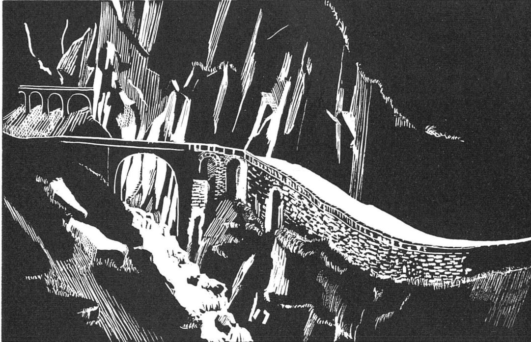
Teufelsbrücke in der Schöllenen

Dank unermüdlicher Forschungsarbeit unserer Laboratorien und weiterer Fortschritte in der Fabrikationstechnik, ist es gelungen, die Lebensdauer unserer Fluoreszenzlampen um ein Vielfaches zu erhöhen, und eine unübertroffene Qualitätsstufe zu erreichen.