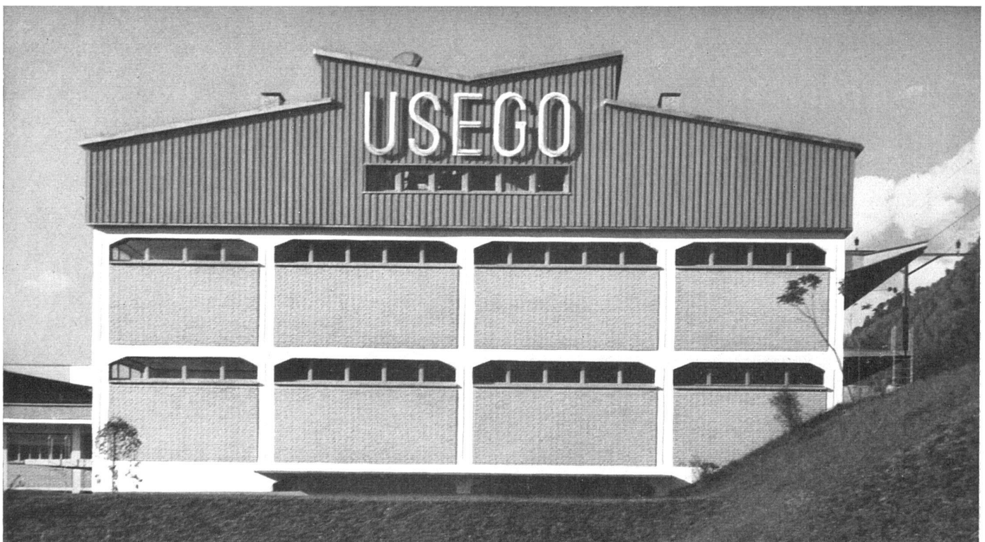
Giebelansicht des Lagers. Hclzaufbau in Blaugrün / Le magasin vu du sud / Stores from South

Konstruktion: Die verschiedenen Funktionen sind in entsprechenden Trakten klar zum Ausdruck gebracht. Die Konstruktion beruht auf einem Eisenbetonskelett, das mit Sichtmauerwerk in Kalksandstein ausgefacht ist. Die Vordächer hängen als Wellaluminiumplatten an Eisenbetonkragarmen. Das Dach ist mit Fural-Aluminium abgedeckt.