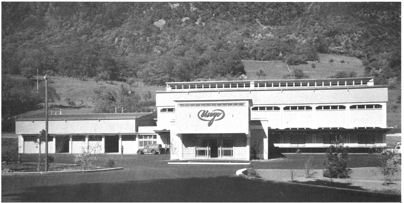
Gesamtansicht von Westen / Vue d'ensemble prise de l'ouest / General view from west