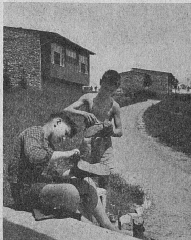
Die «Kleine Stadt» in Granešina bei Zagreb. Architekt: Ivan Vitić, Zagreb