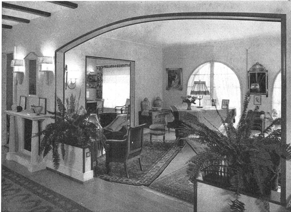
Abbildung zeigt eine Installation mit RAYRAD an Innenwänden und unter Fenstern, unsichtbar

eignen sich vorzüglich für Turnhallen, Schulhäuser, Ladenlokale, Windfänge, Wohnräume, Arbeitsräume, Garagen usw., kombinierbar mit Radiatorenheizung